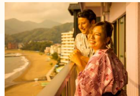
写真は武智さんに撮影して頂いた「西伊豆土肥温泉 碧き風ぎの宿 明治館様」のお写真です https://www.meijikan.com/